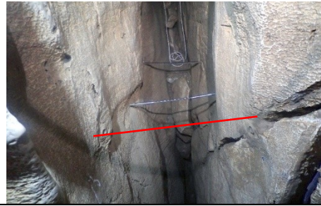
En rouge : emplacement du barreau manquant

Entrée des cavités : CAP – Soucy – Nonceuil