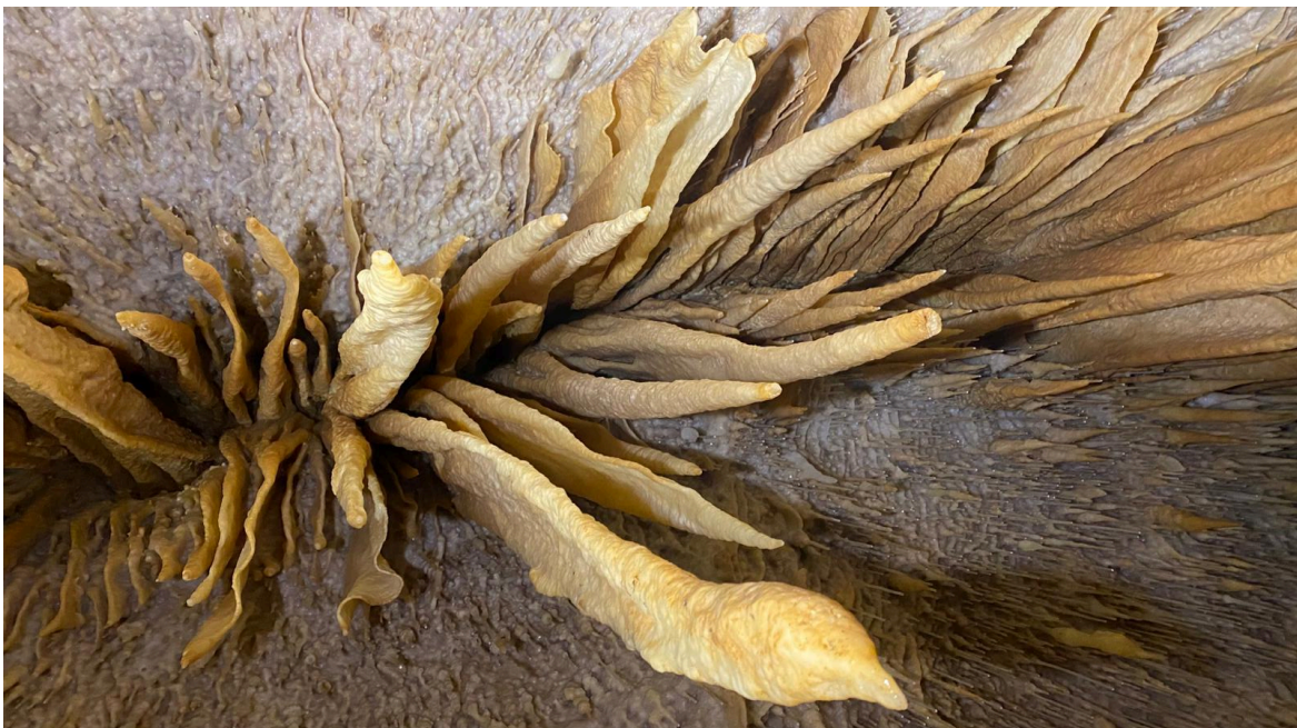
Etonnante coulée le long d'une faille au plafond