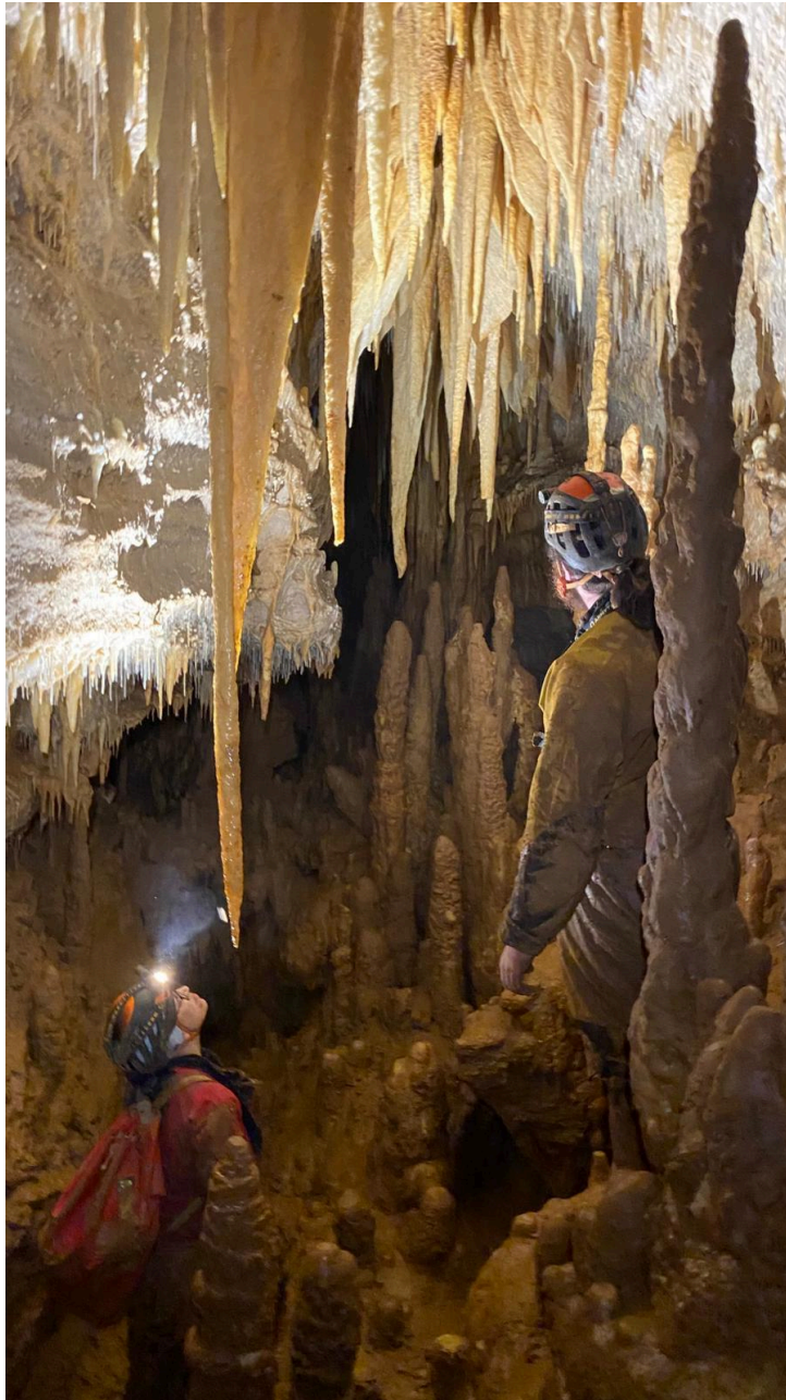
Marron en bas, blanc en haut

La grotte présente plusieurs niveaux, un peu comme dans le Y du Neuvon. Si en bas, c'est la guerre de la boue, en haut, c'est la galerie des merveilles ! Des excentriques de toutes formes et de toutes tailles, des stalactites pointues, hérissées par milliers... On en prend plein les yeux.